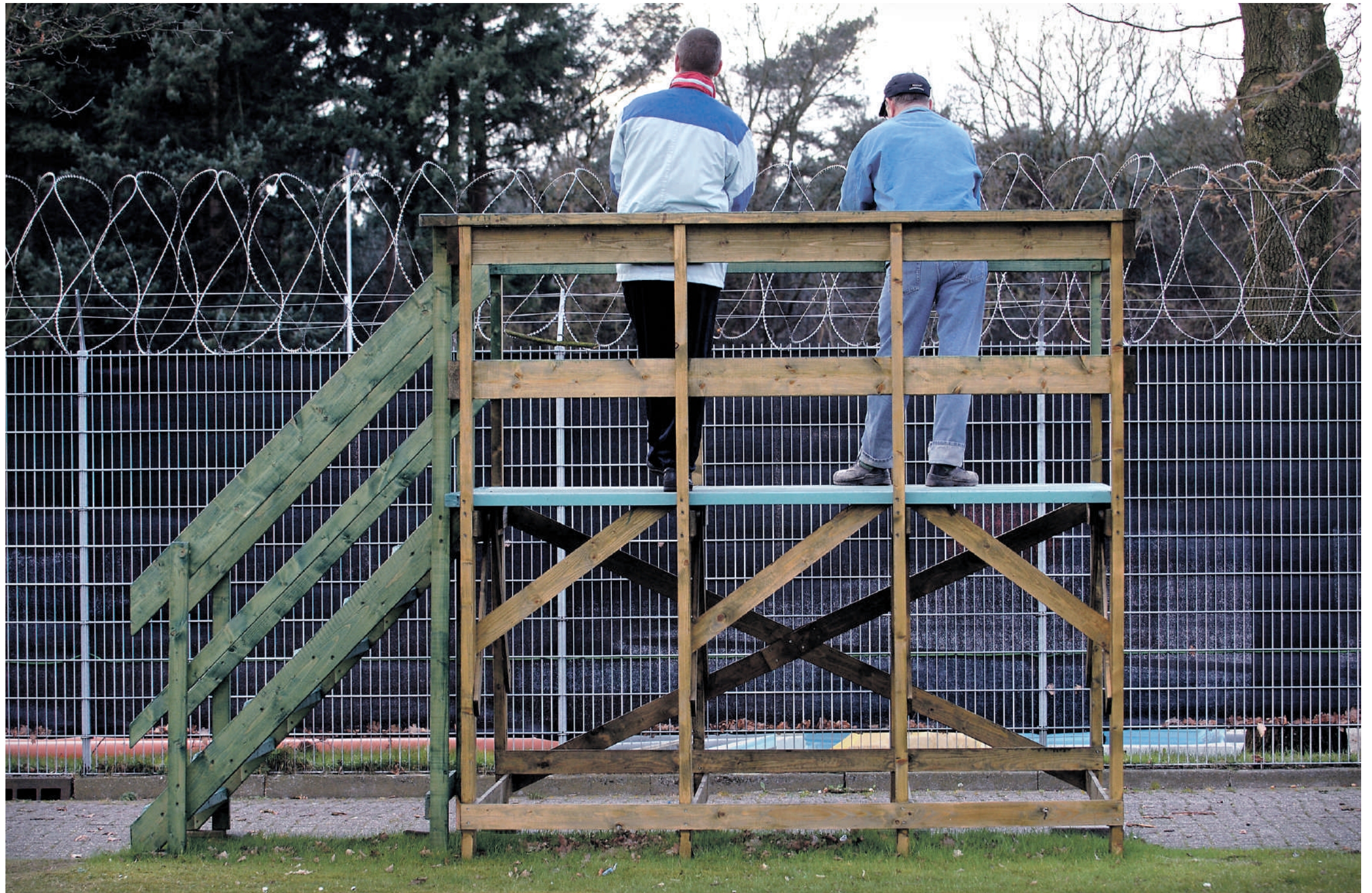
Bewoners van De Corridor kijken vanaf 'het schavot' naar de bouw van hun nieuwe onderkomen, die in 2009 gereed zijn.

Sinds donderdag weten ze ook over wie ze het hebben. Van Pierre, die een smetteloos wit schort heeft voorgebonden, krijgen ze om half één papieren tasje uitgereikt met een lunchpakket. Heel praktisch, want tijdens de lunch vindt ook de rondleiding door de longstay plaats. En zo lopen de advocaat - 'Nee, ik ben nog nooit in een longstay geweest, in een gevangenis trouwens ook niet' -, de psychiater, de rechter en de beleidsmedewerker van Justitie braaf met een broodje in de hand achter een bewoner aan.